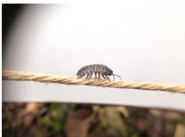
「ダンゴムシ！足は何本かな？」